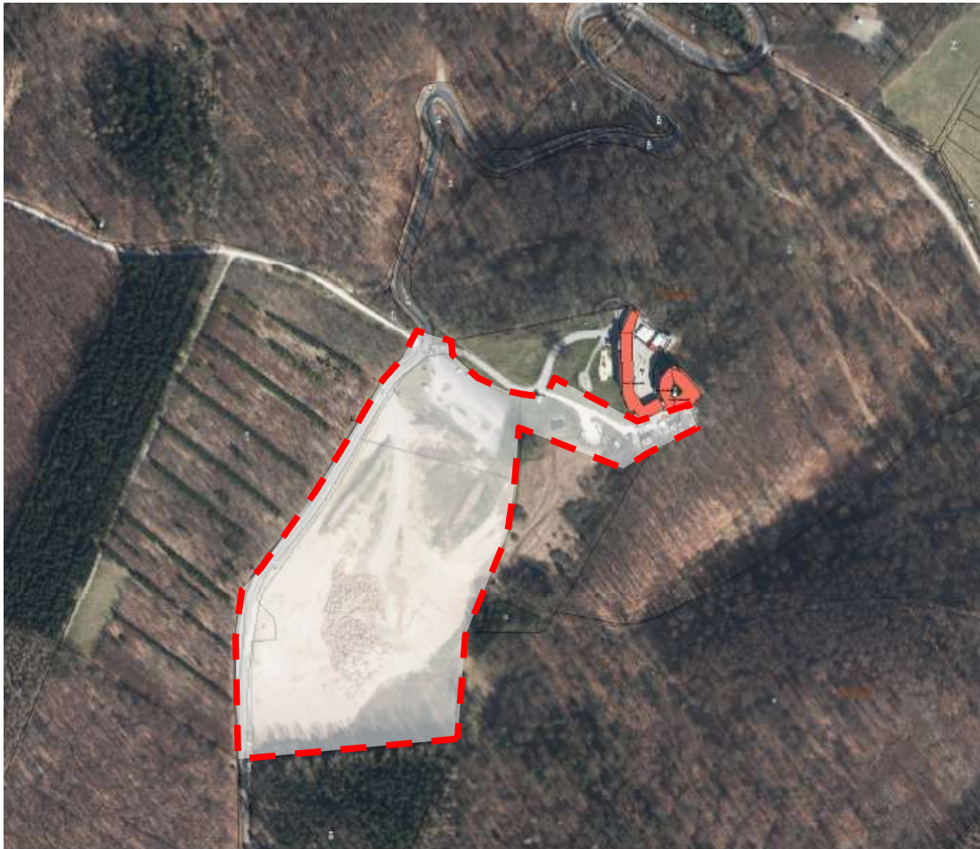
Geltungsbereich B-Plan Nr. 127 „Außengelände an der Burg Scharfenstein“, Ortsteil Beuren (M 1:5.000)