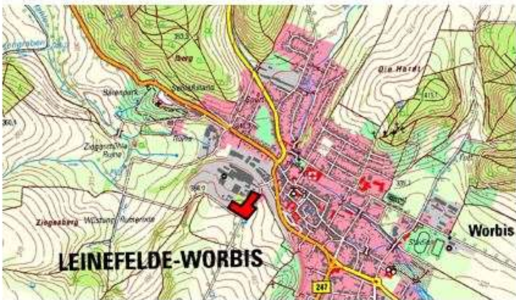
Übersichtskarte (M 1:10000) Stadt Leinefelde-Worbis, Ortsteil Worbis Geltungsbereich VB-Plan Nr.133 „Querstraße“, Ortsteil Worbis