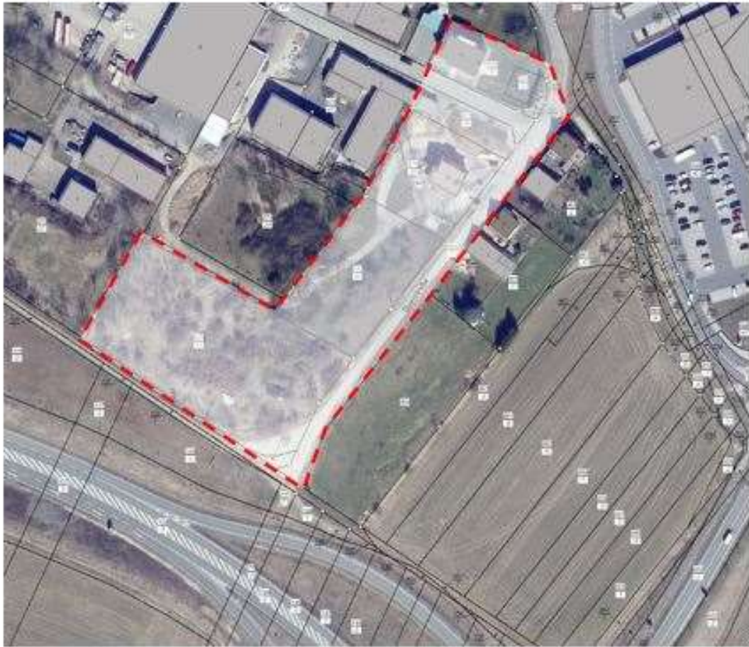
Geltungsbereich des VB-Plan Nr. 133 „Querstraße“, Stadt Leinefelde-Worbis, Ortsteil Worbis (M 1:1500)