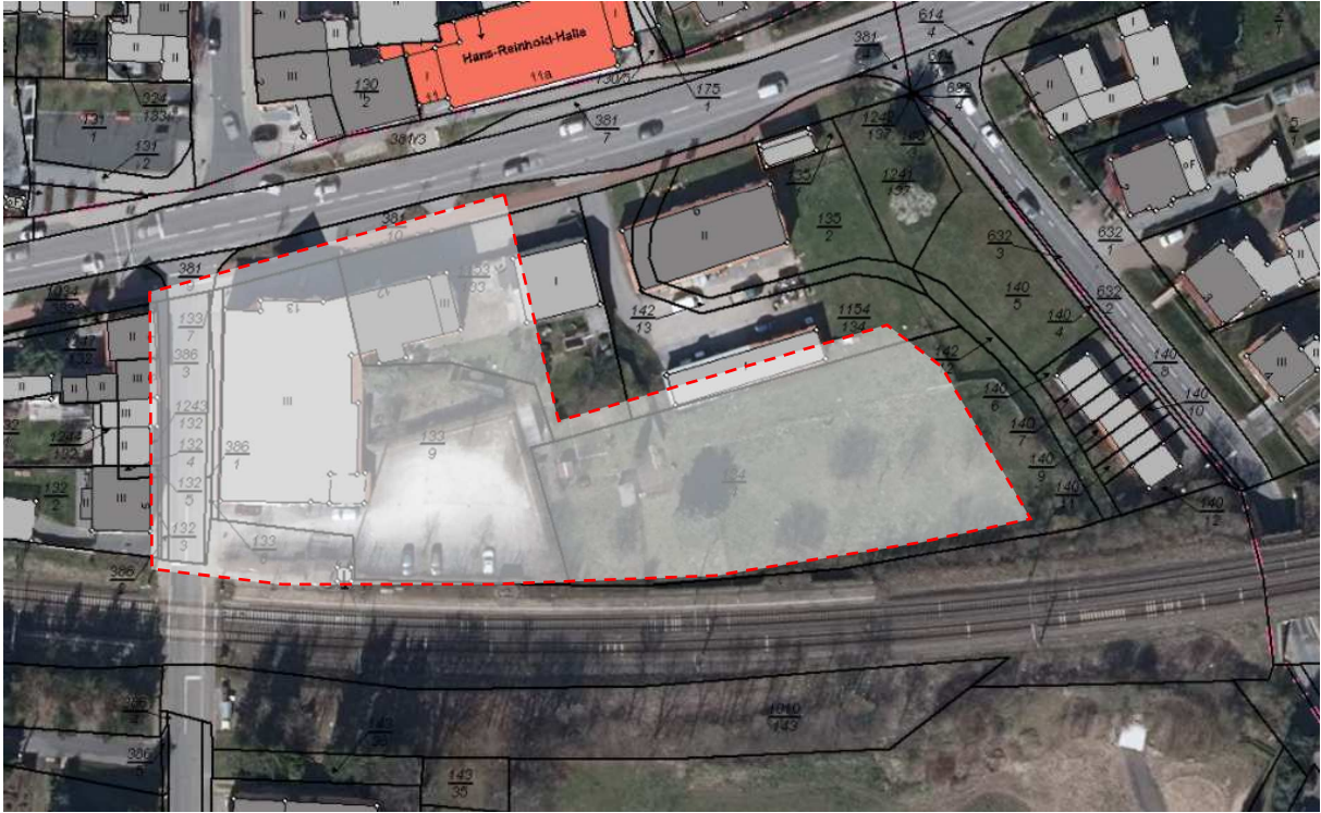
Geltungsbereich des B-Plan Nr. 153 „Gemeindsaal zum Burgtor“, OT Beuren