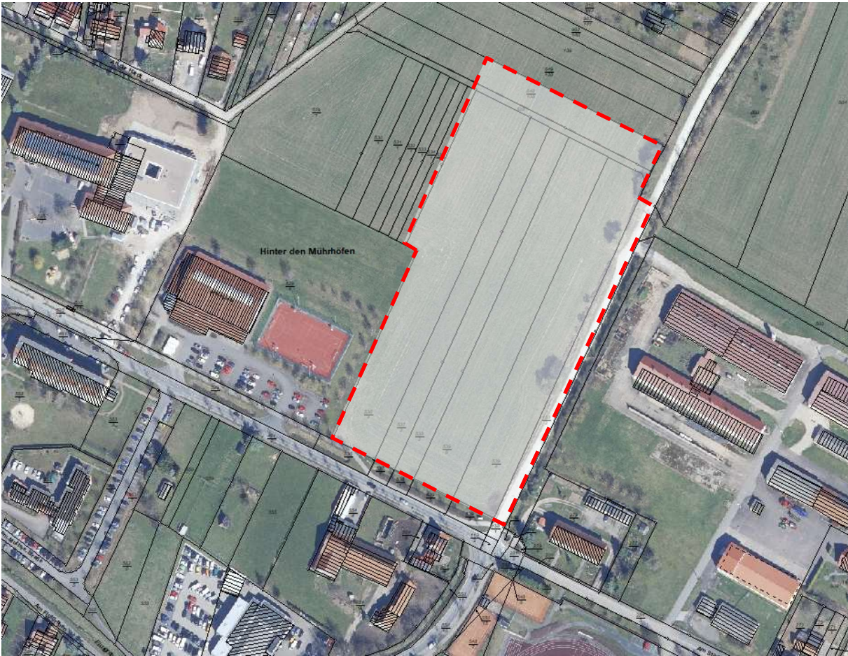
Geltungsbereich der 18. Änderung des Flächennutzungsplanes im Bereich des Bebauungsplanes Nr.108 „Schulwiese“, Ortsteil Worbis