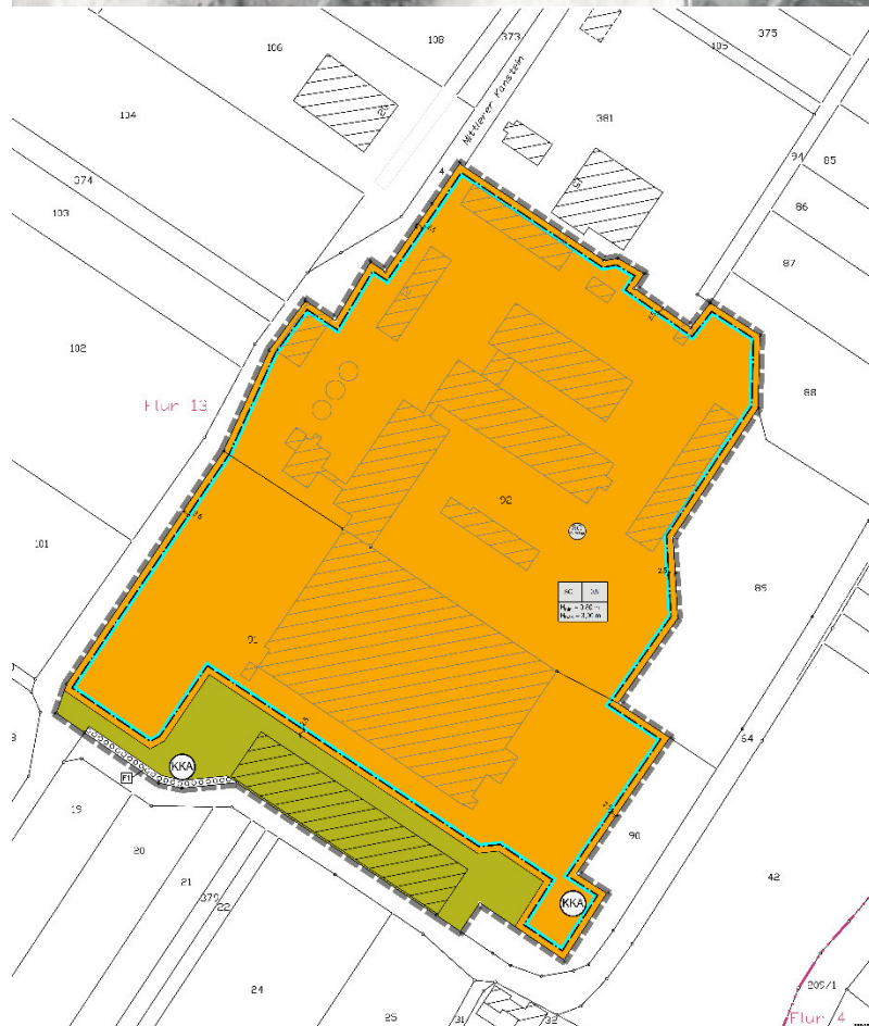
Planskizze des vorhabenbezogenen Bebauungsplanes Nr. 166, Ortsteil Kirchohmfeld