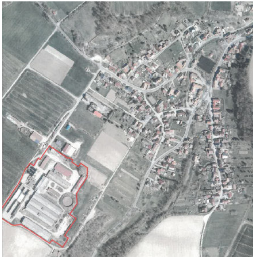
Luftbild Geltungsbereich des vorhabenbezogenen Bebauungsplanes Nr. 166 „Sondergebiet Photovoltaikanlage / Energieerzeugung“, Ortsteil Kirchhofmied

Der räumliche Geltungsbereich der 61. Änderung des FNP und die Lage sind aus nachstehender Planskizze, welche Bestandteil der Bekanntmachung ist, zu ersehen.