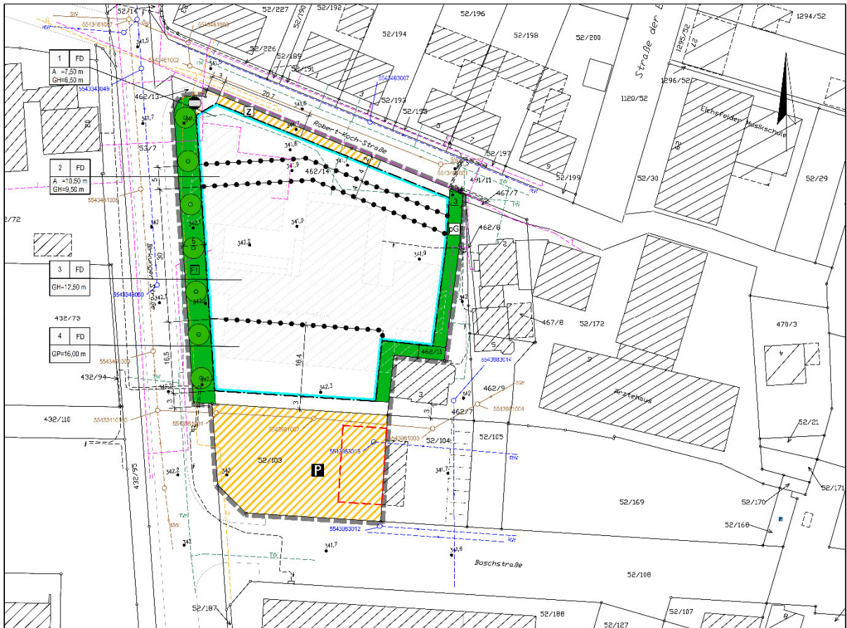
Planskizze des vorhabenbezogenen Bebauungsplanes Nr. 162, Ortsteil Leinefelde