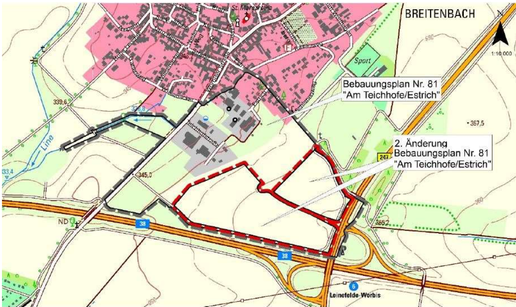
Geltungsbereich 2.Änderung B-Plan Nr. 81 „Am Teichhof / Estrich“, Stadt Leinefelde-Worbis, Ortsteil Breitenbach