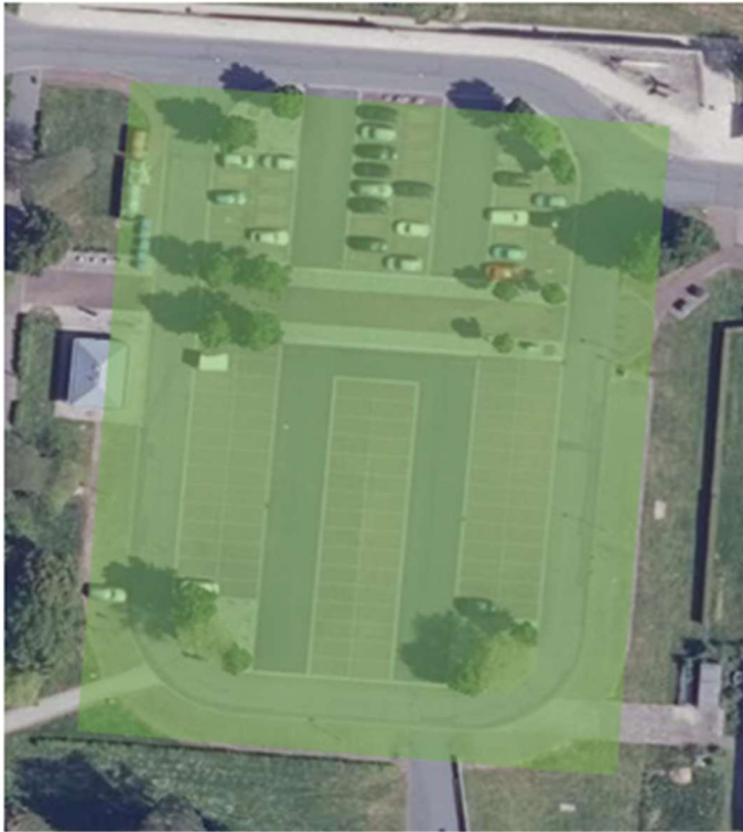
Leinefelde, Zentraler Platz