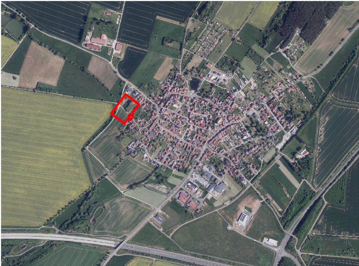
Luftbild mit Lage des Geltungsbereiches