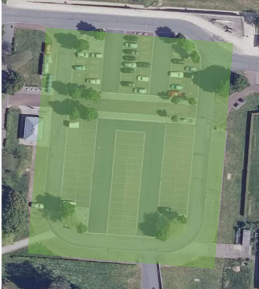
Leinefelde, Zentraler Platz