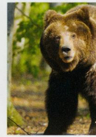
Katja die Stattliche (geb.1991)

Als Winterruhe-Rekordhalter genießt Schwarzbär Jimmy das entspannte Leben im herrlichen Bärenareal und geht täglich ohne Anstrengungen seinen Gewohnheiten nach. Baden, Schlafen, Fressen, dabei sind Nüsse und Weintrauben seine große Leidenschaft.