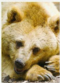
Emma die Niedliche (geb.1991)

Noch schüchtern unterwegs, erkundet die ehemalige Zirkusbärin Daggi die fast fünf Hektar große Freianlage, zupft an Gräsern und Kräuter oder sucht Bärenkumpel Pedro. Leckerli suchen macht ihr sichtlich Spaß.