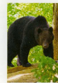
Pedro der Bade-Bär (geb.2004)

Zuvor als „Wanderpokal“ herumgereicht, hat sich Katja hier zu einer brotliebenden Bärenkugel gemacht und durchforscht nun auf flinken Beinen das abwechslungsreiche Gelände. Sie zeigt immer noch oft Stereotypen - das Erbe ihrer Vergangenheit.