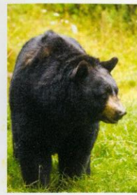
Jimmy der Schwarzbär (geb.1989)

Seit ihrem 9.Lebensmonat lebte Conni im Zoo Halle und baute dort eine abgrundtiefe Abneigung gegen alle Vierbeiner auf. Beim bloßen Anblick schimpft und zetert sie wie wild. Menschen hat sie sehr gerne. Frischen Salat, Wasserplanschen und Sonnenbaden auch.