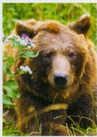
Conni die Zoo-Bärin (geb.1989)

Seit ihrem 9.Lebensmonat lebte Conni im Zoo Halle und baute dort eine abgrundtiefe Abneigung gegen alle Vierbeiner auf. Beim bloßen Anblick schimpft und zetert sie wie wild. Menschen hat sie sehr gerne. Frischen Salat, Wasserplanschen und Sonnenbaden auch.