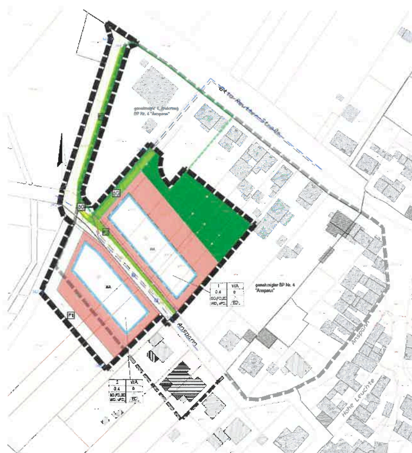
Planskizze (o. Maßstab)