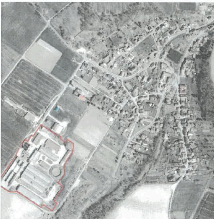
Luftbild Geltungsbereich des vorhabenbezogenen Bebauungsplanes Nr. 166 „Sondergebiet Photovoltaikanlage / Energieerzeugung“, Ortsteil Kirchohmfeld