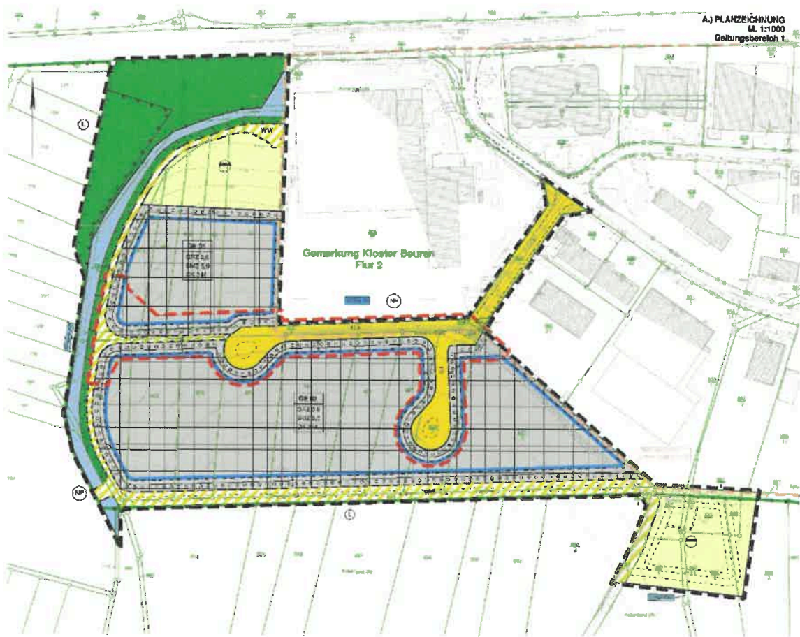
Planskizze (M 1 : 2.000)