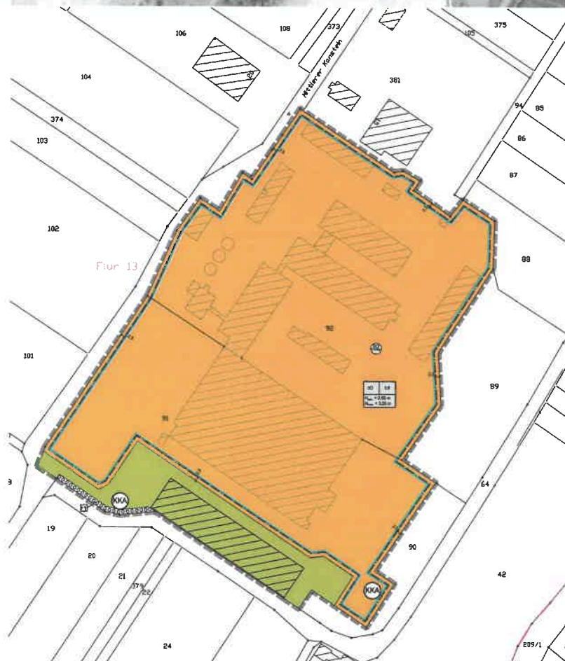
Planskizze des vorhabenbezogenen Bebauungsplanes Nr. 166, Ortsteil Kirchhofmfeld