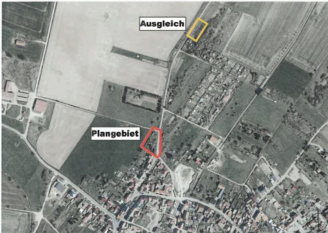
Übersichtsplan (o. Maßstab)