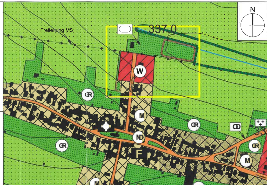
Übersichtskarte Stadt Leinefelde-Worbis, OT Breitenholz